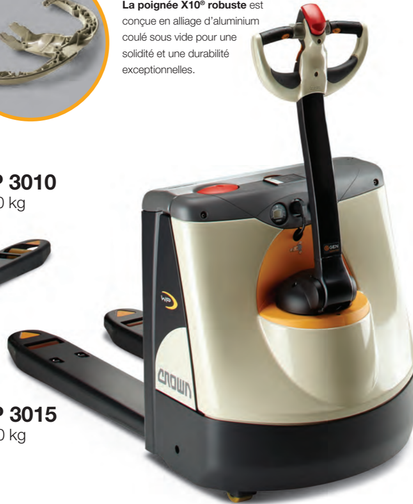
WP 3015 1600 kg