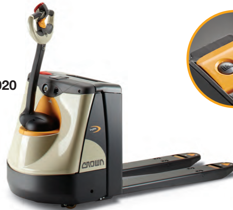
WP 3020 2000 kg