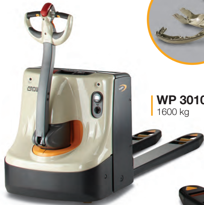
WP 3010 1600 kg

La poignée X10® robuste est conçue en alliage d'aluminium coulé sous vide pour une solidité et une durabilité exceptionnelles.