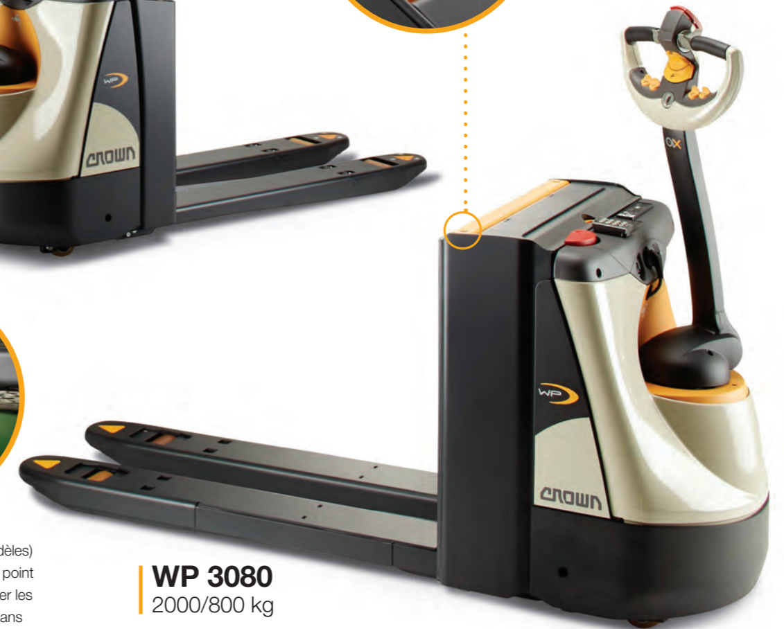
WP 3080 2000/800 kg

Le tirant de levage réglable (uniquement pour certains modèles) positionne l'essieu montant au point le plus haut possible afin d'éviter les endommagements et l'usure dans les applications où le sol est irrégulier.